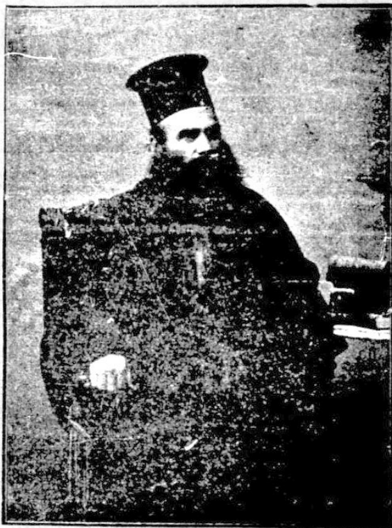
S. S. Protoereul Teodor Constantin

sperie tóte amenințările, că va fi escocmicat, despopt, surghiunit, omorit chiar.